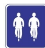
Permitido conduzir lado a lado (placa)

Conduzir as bicicletas uma atrás da outra.