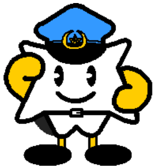
Linh vật biểu tượng cho cảnh sát tỉnh Hiroshima Maple kun

Sở cảnh sát Cảnh sát tỉnh Hiroshima HP: https://www.pref.hiroshima.lg.jp/site/police/ps-index.html