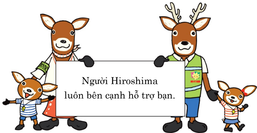
Các linh vật trong Cuộc vận động tất cả cư dân trong tỉnh cùng chung sức “Giảm thiểu tội phạm” Moshika