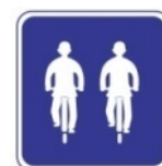
Có thể đi song song (biển báo)

Trừ những trường hợp có biển báo, xe đạp không được phép đi song song với những xe đạp khác. Hãy lưu thông theo một hàng.