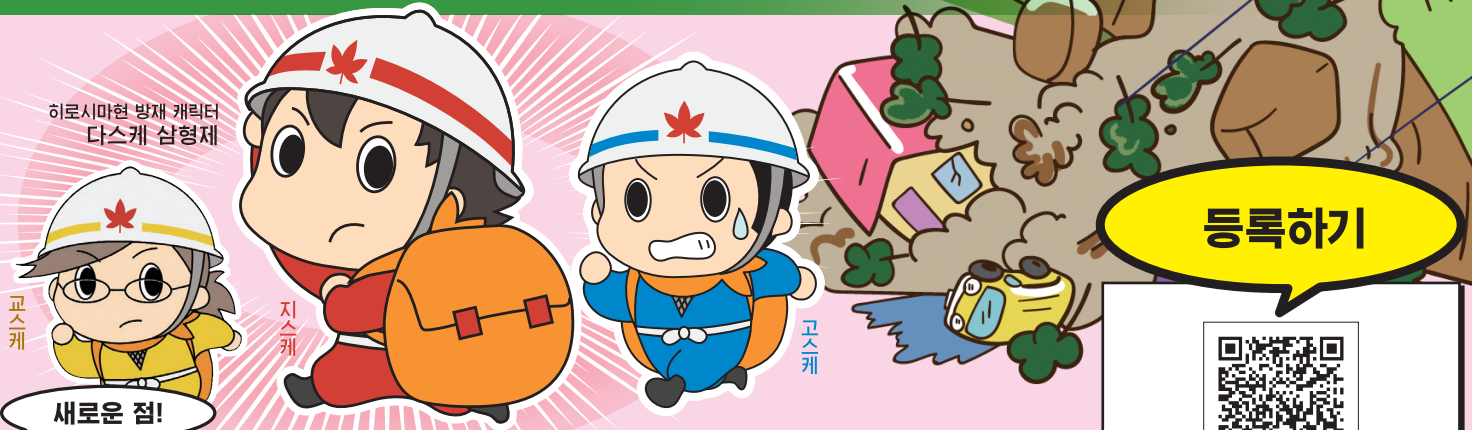
히로시마현 방재 캐릭터 다스케 삼형제

더 알기 쉽게 더 자세히 재해로부터 생명을 지키기 위해 꼭 필요한 정보를 보내 드립니다!