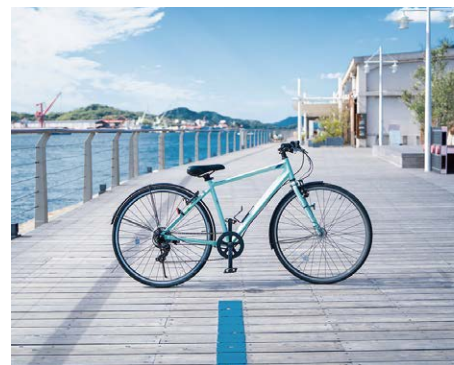
※クロスバイクの一例