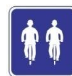
Puede circular en doble línea